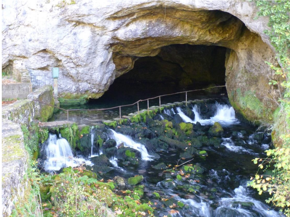
Source de Fontestorbes